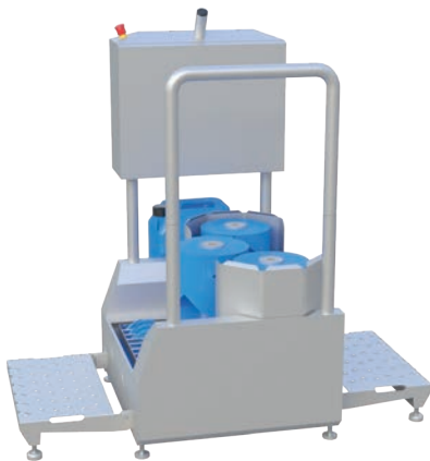
Durchlaufreinigungsmaschine Typ 23830