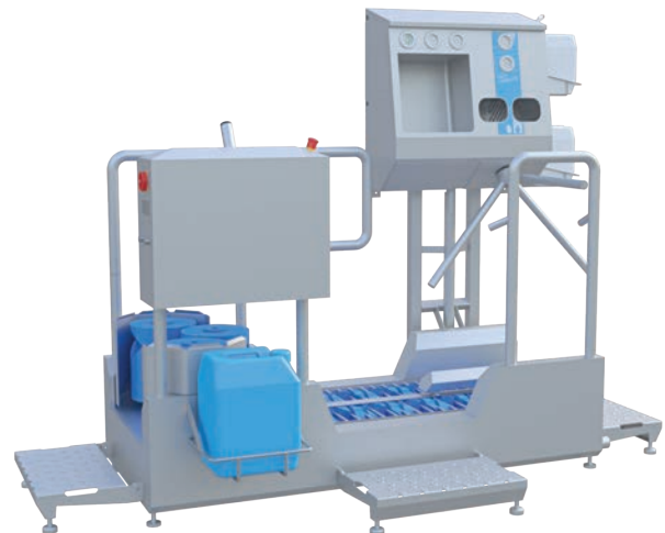
Durchlaufreinigungsmaschine Typ 23830-1000 mit Inlet Complete